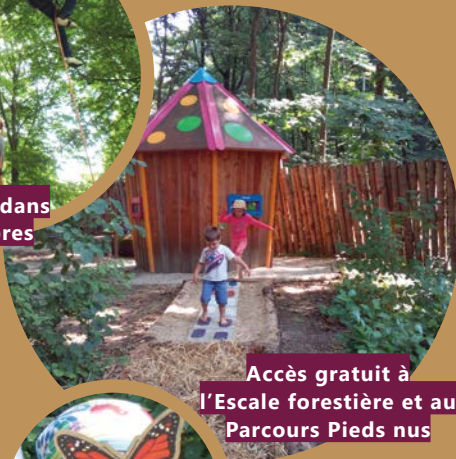
Accès gratuit à l'Escale forestière et au Parcours Pieds nus