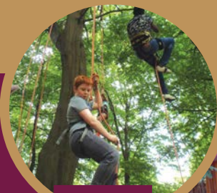
Grimpe dans les arbres

Départ à 10h de l'esplanade de l'Europe Retour à 16h de Bon-Secours